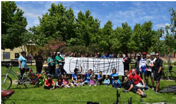
Uno de los encuentros del colectivo pidiendo carril bici Bicicaseter@s

Aunque la configuración urbana de algunos de los barrios rurales de Zaragoza hace difícil la inclusión de carriles bici por su trama urbana , algunos colectivos reivindican medidas en pro de una mejor convivencia con el tráfico de coches y peatones.